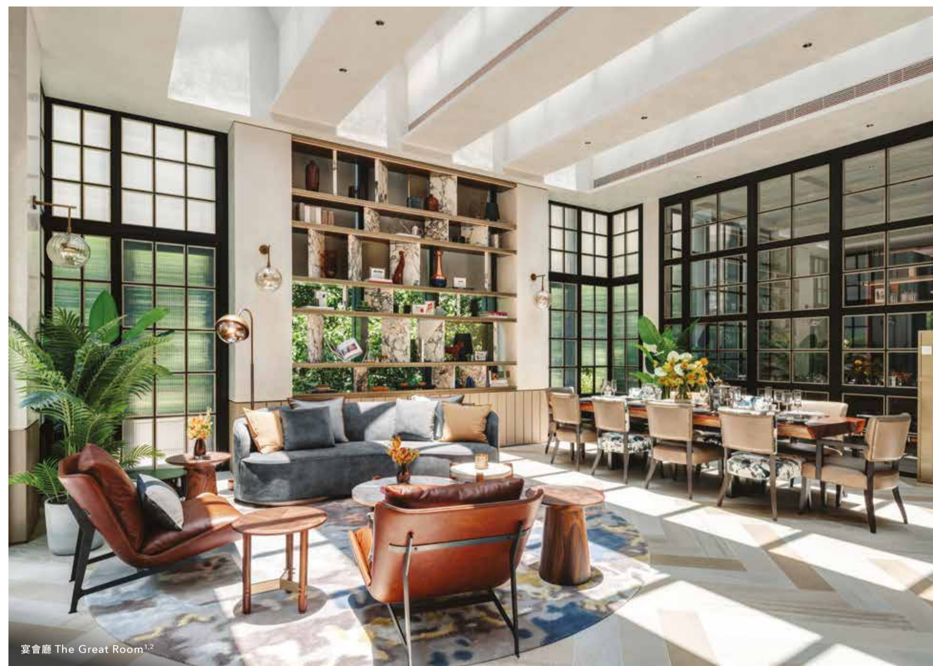
宴會廳 The Great Room 1,2