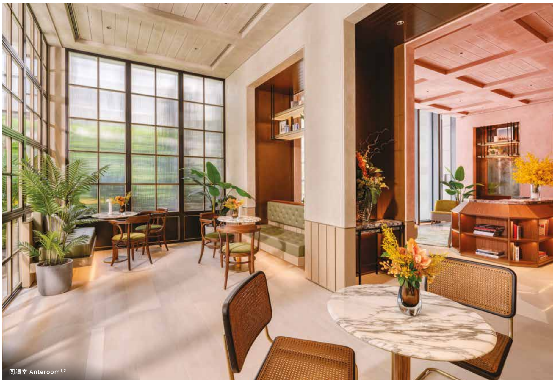
閱讀室 Anteroom 1,2