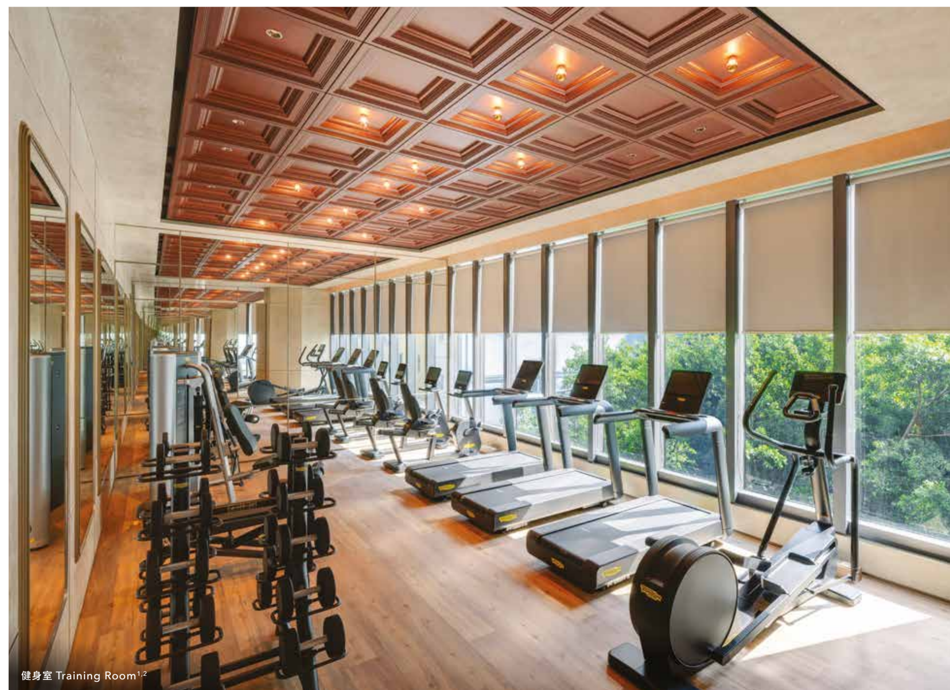
健身室 Training Room 1,2