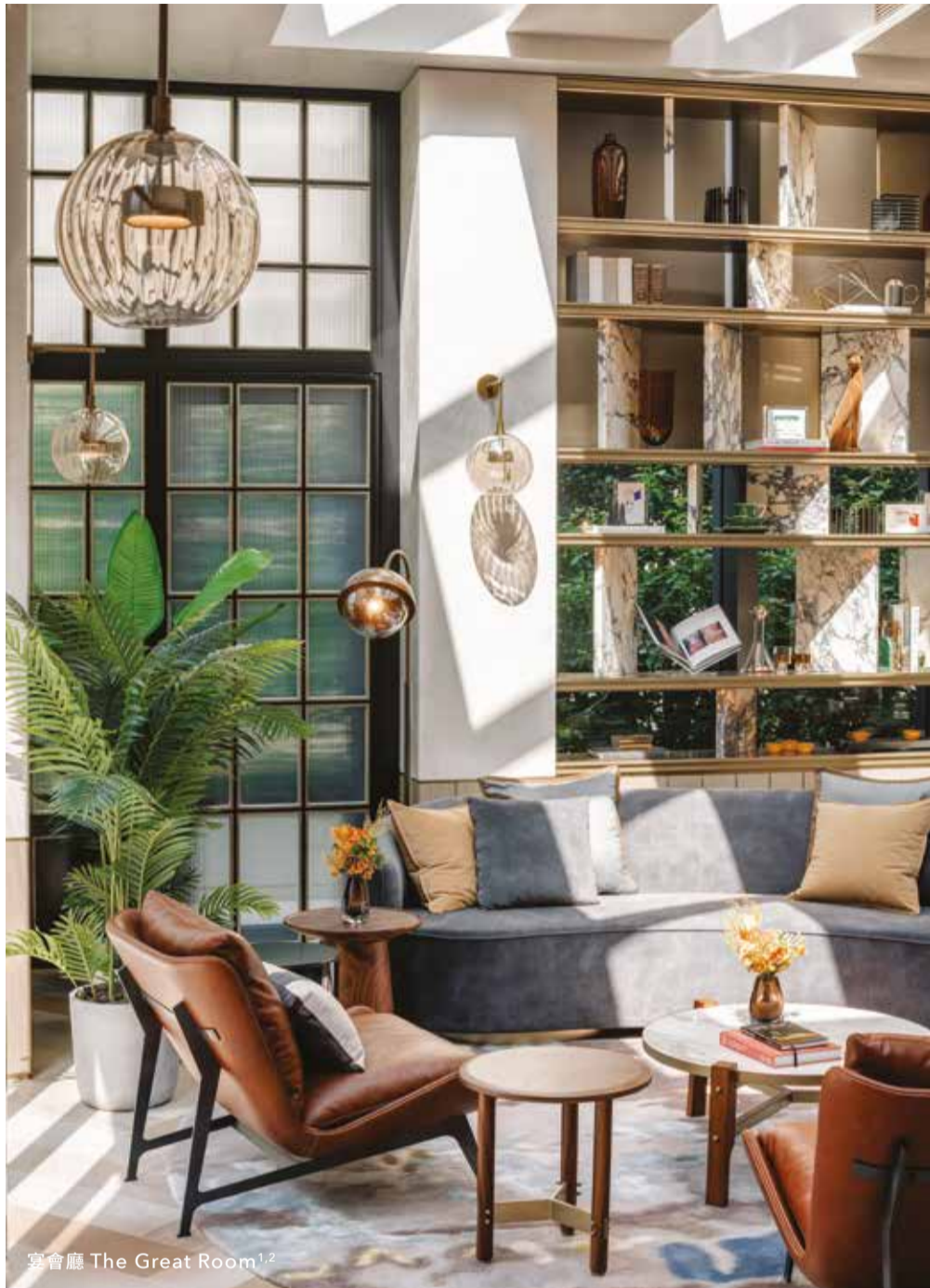
宴會廳 The Great Room 1,2