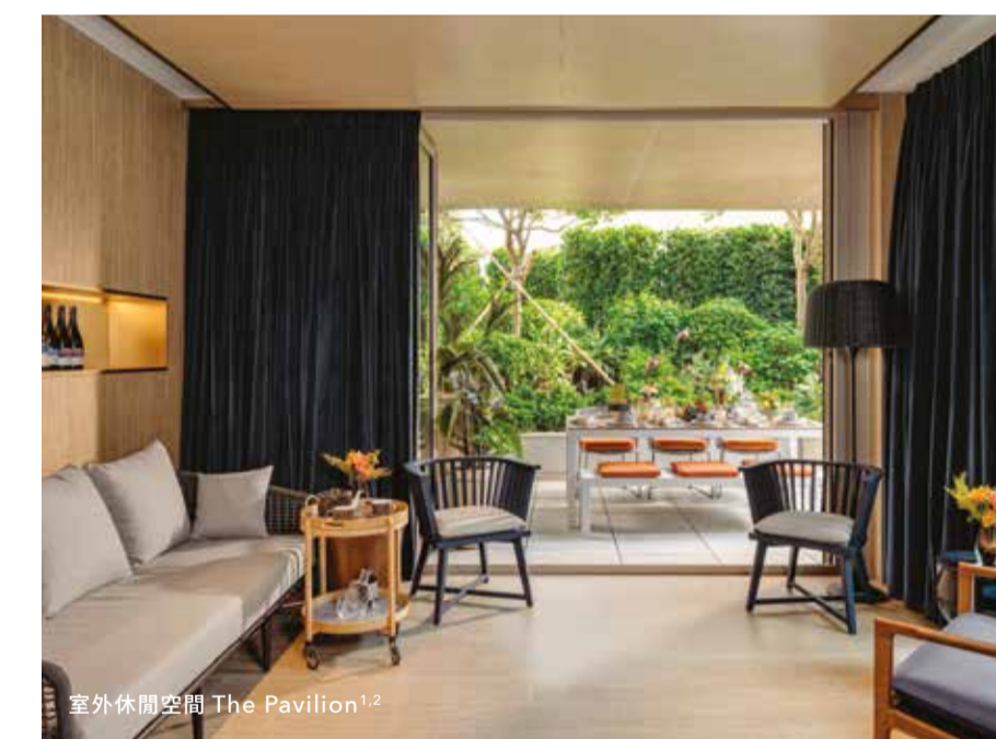
室外休閒空間 The Pavilion 1,2

設計優尚雅致的住客會所，設有THE GREAT ROOM宴會廳、ANTEROOM閱讀室、THE ROASTERY共享休閒空間、THE PAVILION室外休閒空間、TRAINING ROOM健身室 2 ，或動或靜，全然滿足休閒所需。