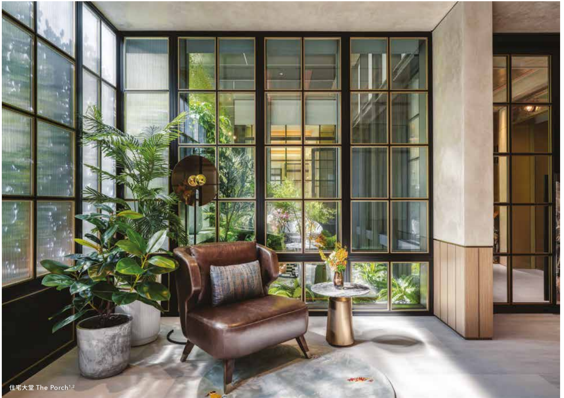
住宅大堂 The Porch 1,2