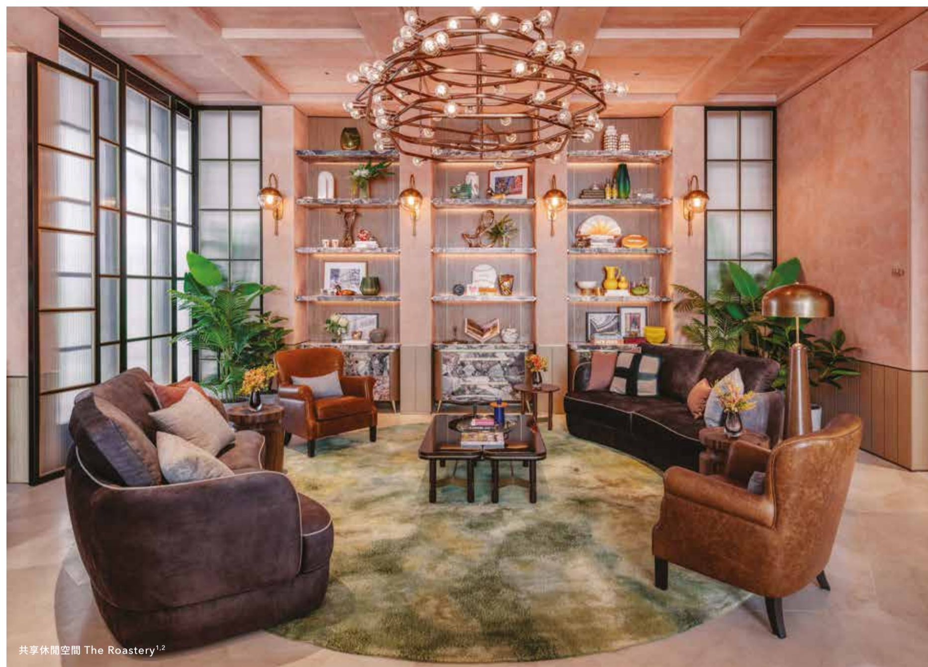
共享休閒空間 The Roastery 1,2