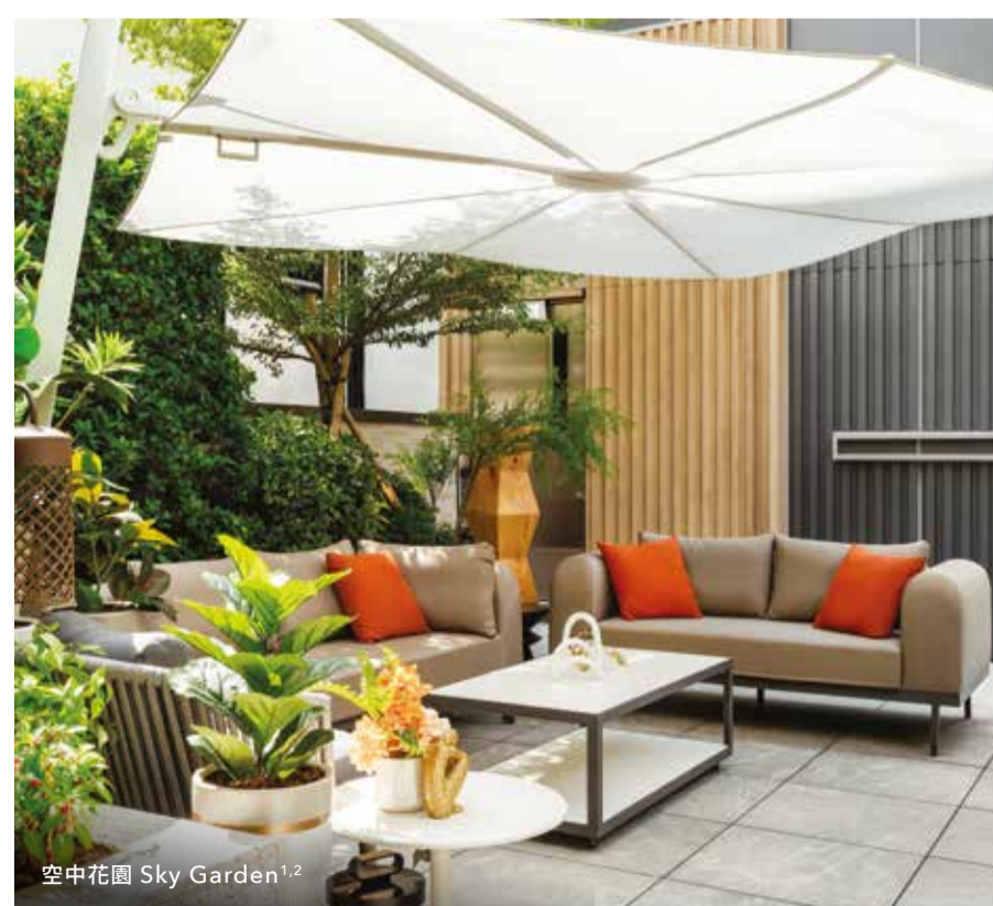
空中花園 Sky Garden 1,2

住客會所以紐約曼克頓區為設計藍本，由著名的建築與室內設計事務所via.負責設計。設計語言以亮麗色調，演繹出所在社區的獨有活力。